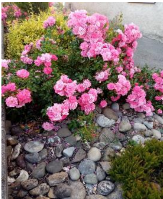
Taille de rajeunissement de rosiers buisson