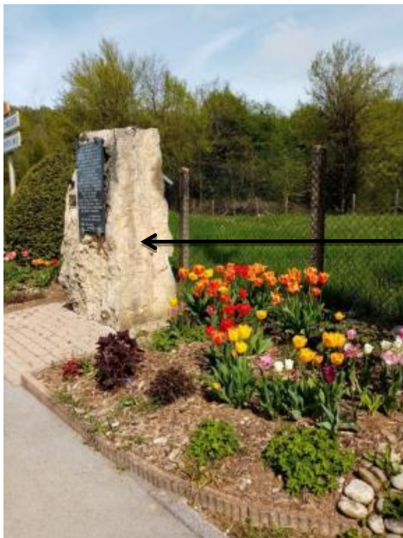
Stèle rue Joly Bois