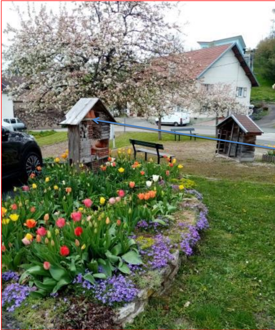
Hôtel à insectes