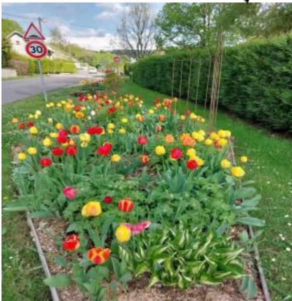
Massif rue Joly Bois