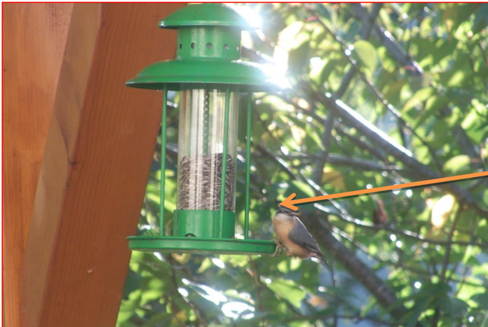
Nourrissage en hiver